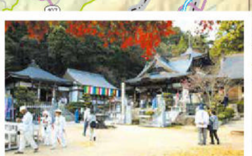
• No. 89 Temple de Okuboji (Sanuki / H-3) C'est le dernier temple sur le chemin du pèlerinage. Les pèlerins peuvent y faire offrir de leur chapeau de paille et de leur canne qui les ont accompagnés sur le chemin. Les couleurs de l'automne sont ici d'une grande beauté.