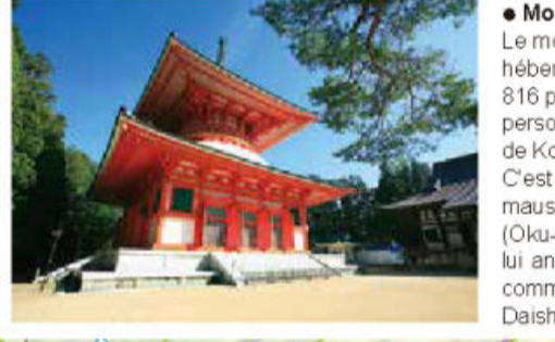
• Mont Kôya (Kôya / L-3) Le mont Kôya, situé dans la préfecture de Wakayama héberge une grande communauté monastique de plus de 3 000 personnes toutes autorisées à y vivre avec au centre le temple de Kôpôji. Site de l'héritage mondial depuis 2004. C'est devenu une tradition parmi les pèlerins de visiter ce mausolée de Kôbo Daishi dans le temple intérieur (Oku-no-in) après avoir accompli le pèlerinage pour pouvoir lui annoncer sa completion. D'autres pèlerins préfèrent commencer le pèlerinage en annonçant leur départ à Kôbo Daishi pour lui demander son aide sur le chemin.