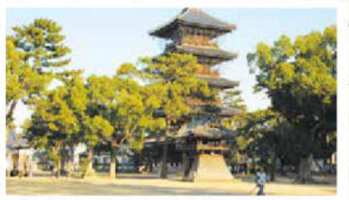
• No. 75 Temple de Zentsuji (Zentsuji / F-3) C'est le lieu de naissance du mont Kôya. La ville de Zentsuji s'est développée grâce au temple qui se trouvait ici. C'est un des trois plus importants temples reliés à Kôya avec le Kôpôji sur le mont Kôya (département de Wakayama) et le Tôki à Kyôto. On y trouve un musée exposant des trésors de l'art bouddhiste.