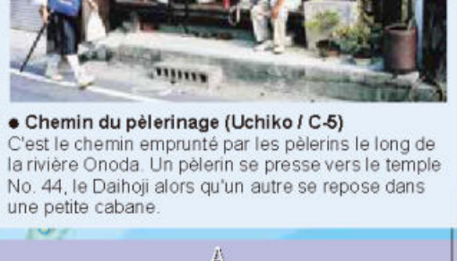
• Chemin du pèlerinage (Uchiko / C-5) C'est le chemin emprunté par les pèlerins le long de la rivière Onoda. Un pèlerin se presse vers le temple No. 44, le Daijôji alors qu'un autre se repose dans une petite cabane.