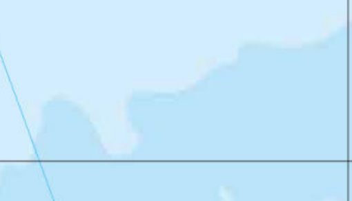
• No. 24 Temple de Hotsumisakiji (Muroto / H-7) Ce temple est à l'extrémité du cap de Muroto-misaki, un des lieux où l'on trouve des plantes sub-tropicales à Shikoku. On dit que Kobo Daishi a fait une partie de son apprentissage dans une grotte de la région.