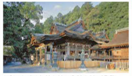
• No. 56 Temple de Sankakuji (Shikokuchô / F-4) Le nom a pour origine l'autel du rituel du feu (goma) créé par Kôka. Le terrain du temple mouillé par les pluies de mai offre un paysage de verdure dont le contraste avec les fleurs blanches des iris apaise l'âme.