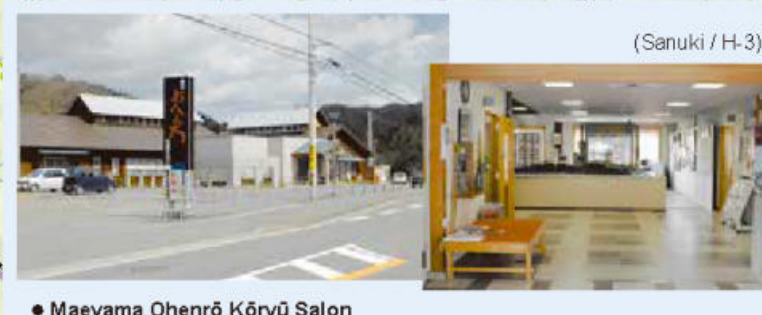
• Mayama Onens Kôryô Salon (Centre communautaire de la communauté des pèlerins / musée) Cet établissement est situé entre le temple No. 87, Nagaoji et le temple No. 88, Okuboji. Il dispose d'une grande salle exposant des matériaux reliés au pèlerinage ainsi que d'un salon où il est possible de rencontrer d'autres pèlerins. Les matériaux exposés donnent accès à une compréhension profonde du pèlerinage. On peut aussi y échanger des informations sur le pèlerinage. Les pèlerins sont bienvenus. Entrée gratuite, ouvert de 9:00 à 18:00.